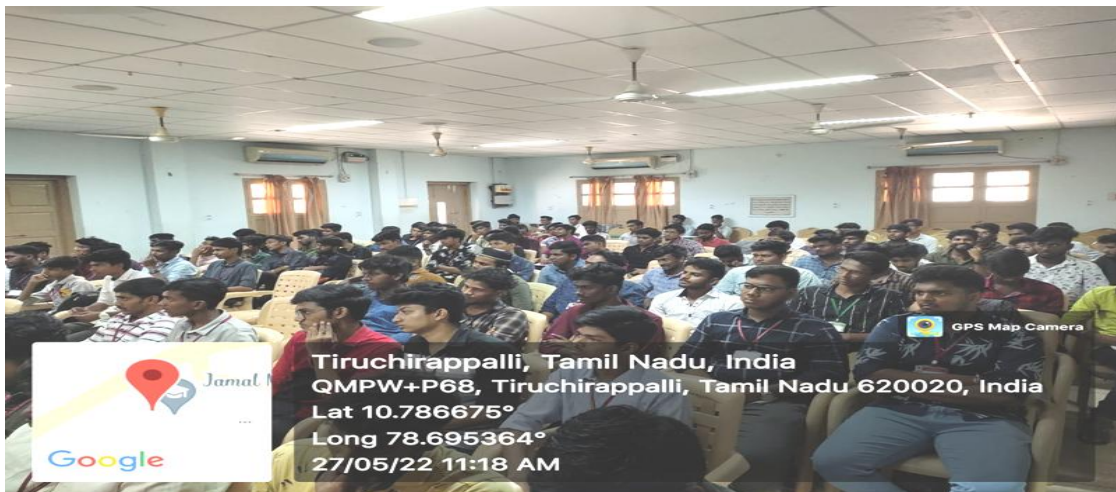
A Section of Audience in the Special Lecture on “Marine Resources & Fish Rearing Practices” on 27/05/2022.